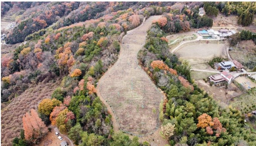
農福連携型就労訓練事業を行うぶどう農園

竹原市では、ぶどう栽培に歴史があり、市内に 29 農家が従事しており、9.6ha のぶどう園が存在している。2020 年にオーナー不在となったぶどう園の活用を模索している中で、八天堂、宗越福祉会より生活困窮者の就労訓練を中心とした農福連携事業について提案を受け現所有者とのマッチングを行い相互理解のもと 2021 年より運営が開始された。