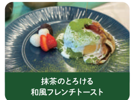
抹茶のとろける 和風フレンチトースト