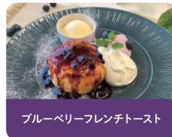
ブルーベリーフレンチトースト