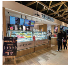
▲フィリピン・マニラ

八天堂は日本のみならず、シンガポール、カナダ、マレーシアで店舗展開をしています。2023年8月からはアメリカ・ロサンゼルスJALUX様 J.SWEETS店や、2024年10月からはフィリピン・マニラMITSUKOSHI BGC様のTokyo Delights店でも販売。また、ベトナムホーチミン、ハノイでの販売もスタートしました。「くりむパン」が世界に広がり、世界の皆さまに笑顔になっていただけるように、私たちは走り続けます。