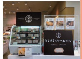
▲アメリカ・ロサンゼルス