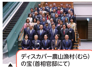
ディスカバー農山漁村(むら)の宝(首相官邸にて)